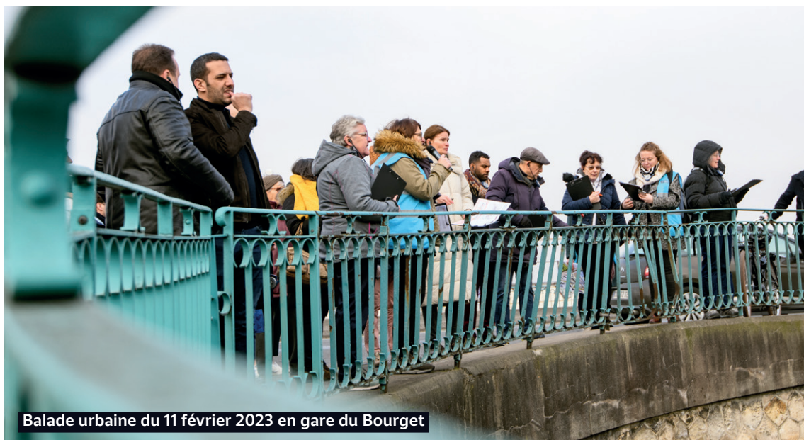
Balade urbaine du 11 février 2023 en gare du Bourget