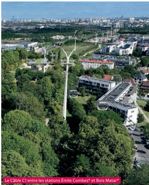
Le Câble C1 entre les stations Émile Combes* et Bois Matar*