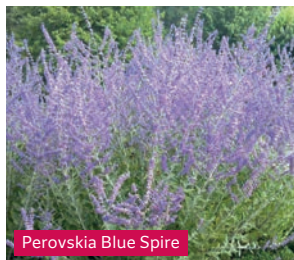
Perovskia Blue Spire