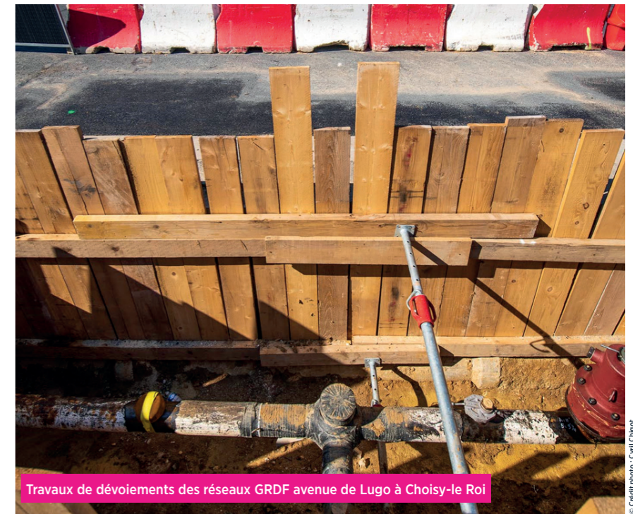
Travaux de dévoiements des réseaux GRDF avenue de Lugo à Choisy-le Roi

Tandis que les études dites de Projet touchent à leur fin, les premiers chantiers s'ouvrent depuis le début d'année. Ces travaux préparatoires qui consistent notamment à dévier les réseaux souterrains (eau, gaz, électricité, télécommunications, assainissement, etc.) et à préparer le terrain en surface afin d'accueillir la voie dédiée au futur bus Tzen 5, seront suivis des travaux d'infrastructures courant 2024.