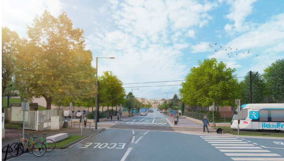
Projet d'aménagement paysager - Rue de la Bruyère à Poissy (Illustration non contractuelle)

L'enquête publique environnementale du prolongement du tram T13 entre Saint-Germain-en-Laye et Achères se tiendra du samedi 15 juin au lundi 15 juillet inclus, sous l'égide d'une commission d'enquête indépendante.