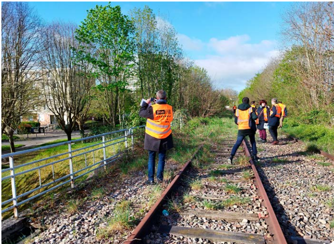
Visite des services environnementaux - Ancienne Grande Ceinture à Poissy

Les aménagements prévus dans le cadre de la requalification urbaine qui accompagne le prolongement du tram T13 permettront de répondre aux nouvelles exigences environnementales et à l'évolution des comportements en matière de mobilité.