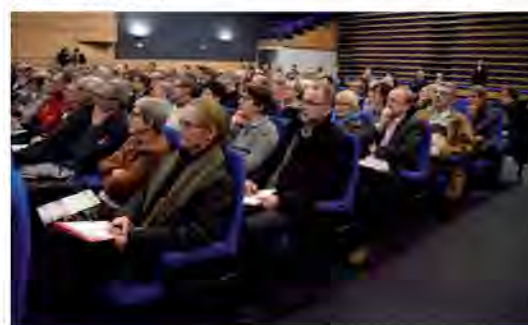
Réunion du 17 mars

La rencontre voyageurs a fait l'objet d'un compte-rendu mis en ligne sur le site Internet et figurant en annexe du présent bilan.