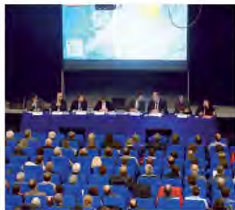
Rencontre riverains du 31 mars 2016

Cette rencontre, initialement prévue pour une soixantaine de personnes, a été ouverte à davantage de participants pour tenir compte de la forte mobilisation. Elle a permis de diffuser une information précise et détaillée par secteur aux personnes les plus riveraines concernées par le tracé urbain et de répondre à leurs questions spécifiques (cf. présentation en annexe).