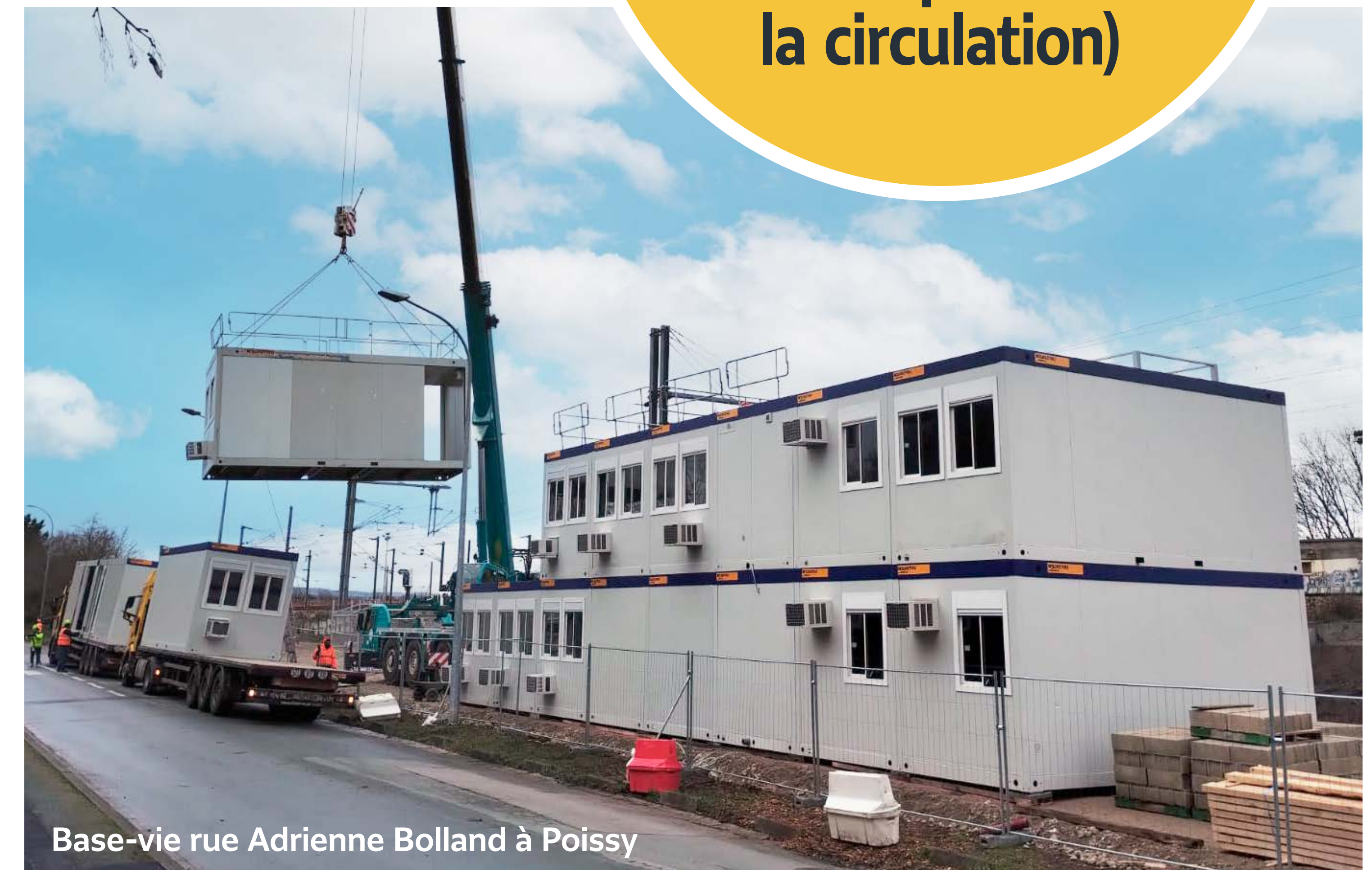
Base-vie rue Adrienne Bolland à Poissy

Finition des enrobés et ouverture de la base vie