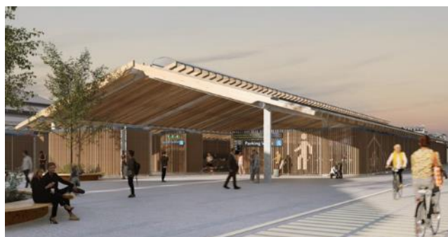
Vues extérieures et intérieures de la nouvelle halle à vélos