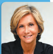
Valérie PÉCRESSE Présidente de la Région Île-de-France Présidente du STIF

C'est aussi la raison pour laquelle j'ai souhaité instaurer un dialogue direct avec toutes les associations en allant à leur rencontre, comme ce fut le cas le 29 juin pour présenter le plan de modernisation du matériel roulant et le 20 septembre pour échanger sur la lutte contre la fraude ou la création de 10 000 places supplémentaires dans les Parcs Relais. Toutes les équipes du STIF s'inscrivent dans cette écoute et ce dialogue renforcés, qui sont la meilleure garantie de la réussite des actions engagées pour changer les transports en Île-de-France.