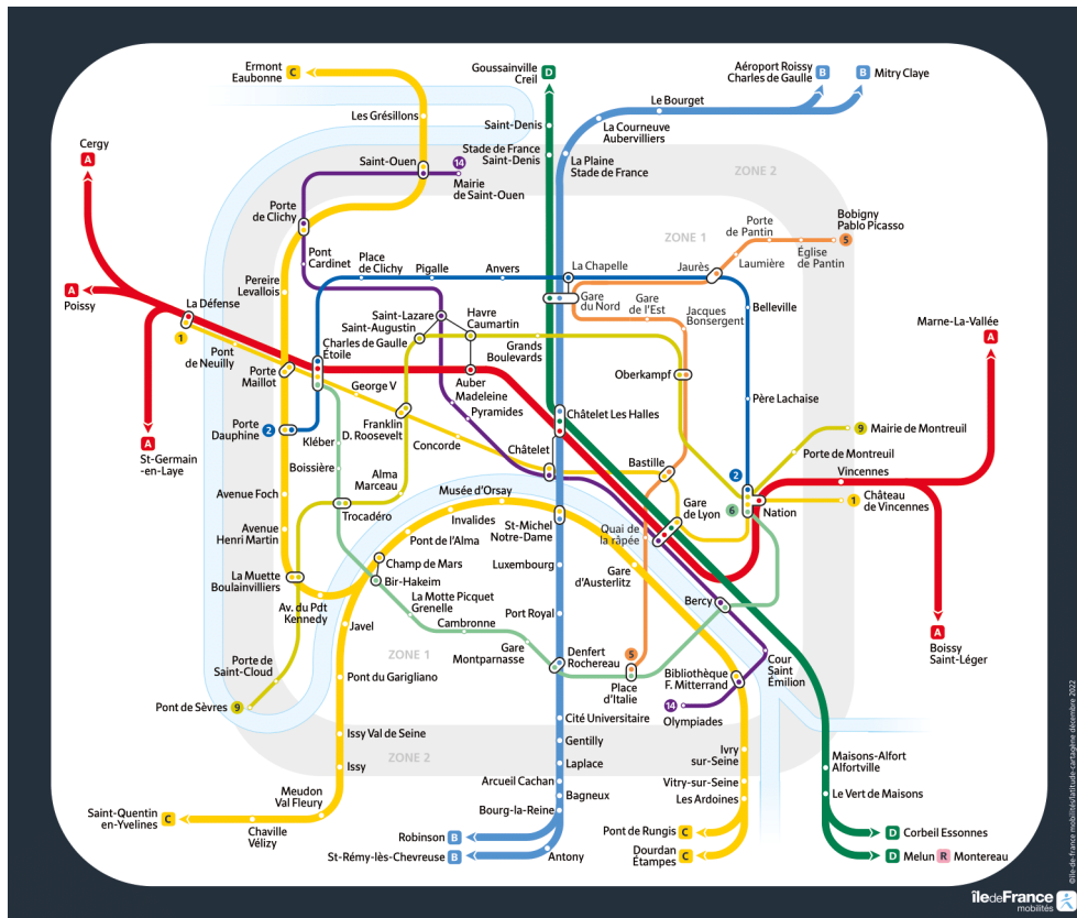
Nuit du 31 décembre 2022 : plan des lignes de métro en circulation

Pour télécharger le plan des lignes de metros en circulation pour la nuit du 31 décembre 2022, c'est ici .