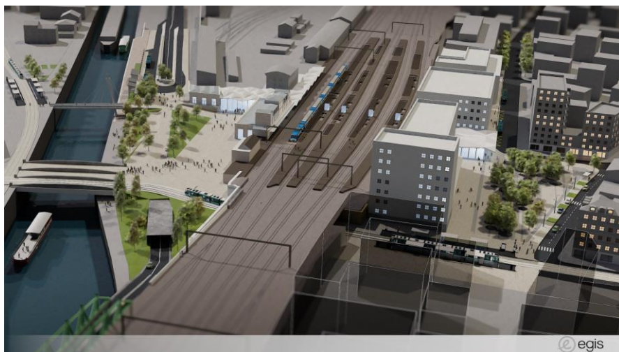
Vue générale de l'aménagement de la gare de Saint-Denis

Pour répondre aux besoins des voyageurs, Île-de-France Mobilités a lancé les études pour améliorer la situation. Elles ont été présentées au public du 11 septembre au 6 octobre 2017.