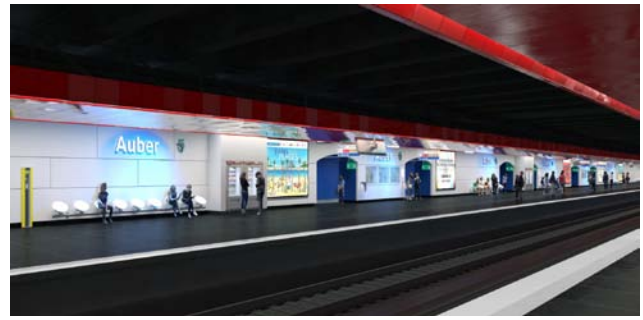
Les quais – Etat actuel/état projeté