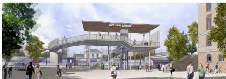
L'accès côté Seine - Etat actuel/état projeté