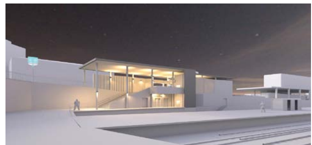
Façade du bâtiment voyageur niveau « quais » de l'accès Ouest – Etat actuel/état projeté