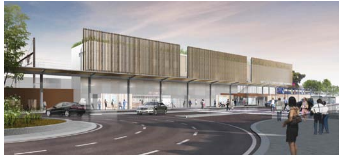
Le bâtiment voyageur - Etat actuel/état projeté