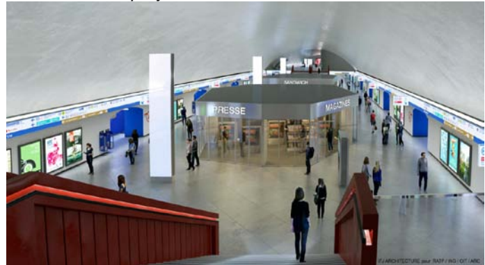
La salle des échanges – Etat actuel/état projeté