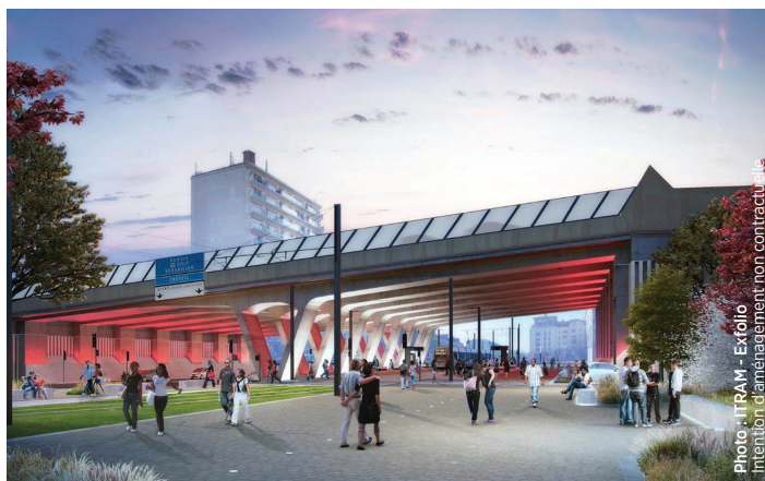
intention d'aménagement non contractuelle