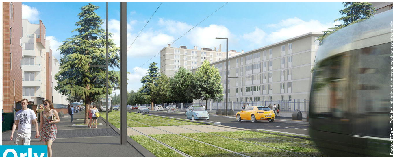
Intention d'aménagement non contractuelle