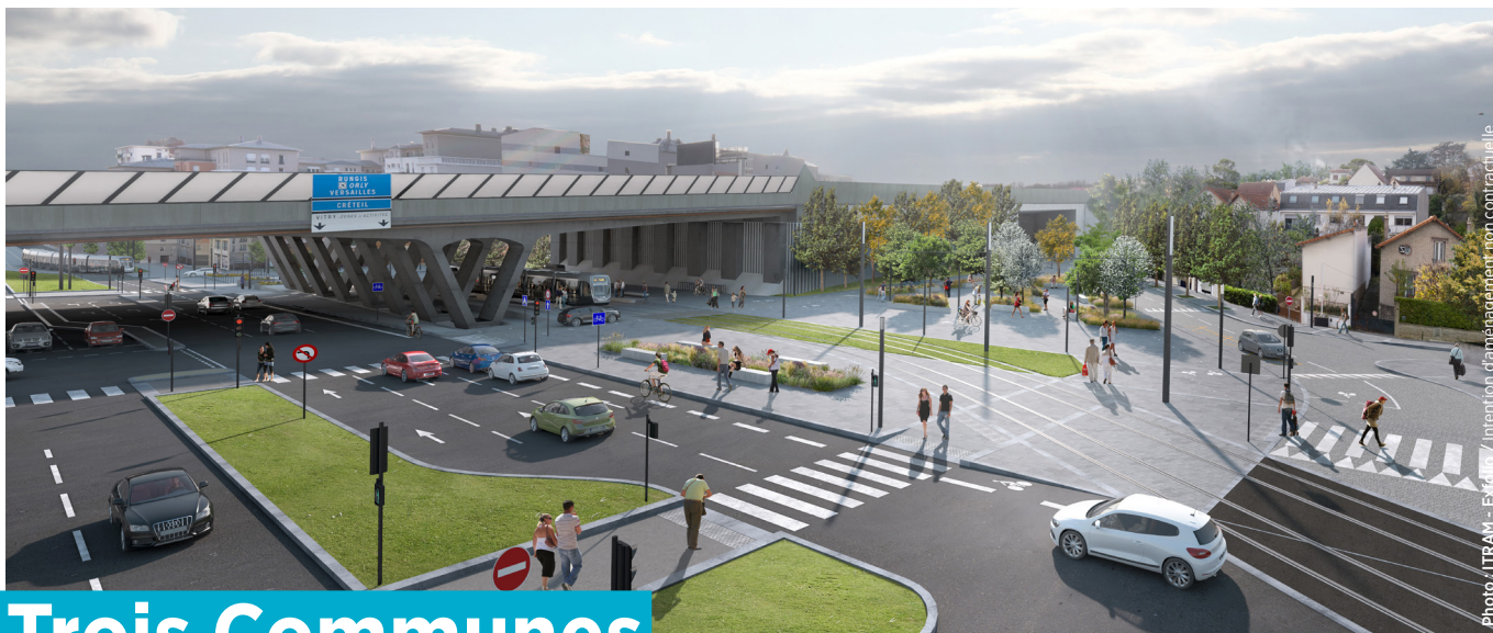
intention d'aménagement non contractuelle