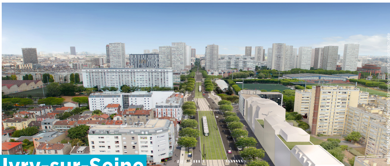
Photo : TRAM - Evry - Présentation aménagement fonction contractuelle