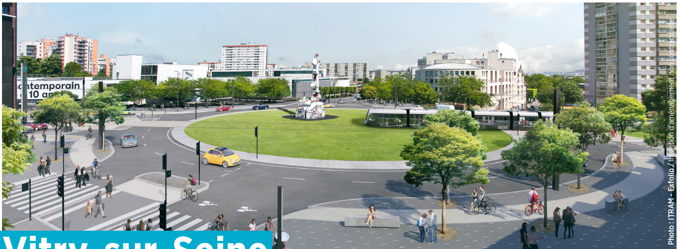
Photo : ITRAM - Exfolio / In Position d'aménagement non contractuelle