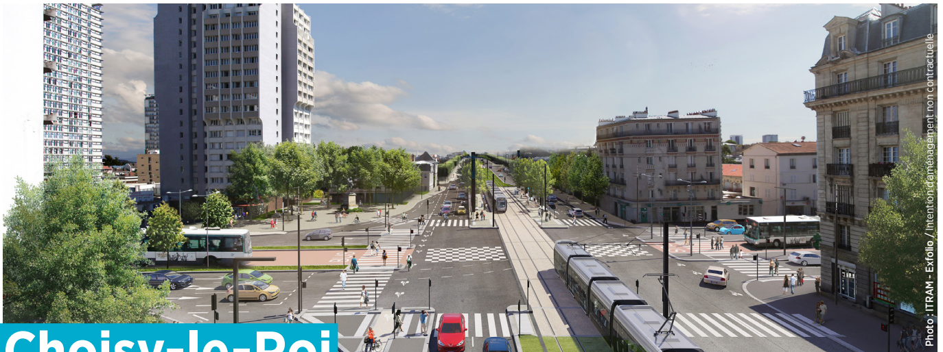
Intention d'aménagement non contractuelle