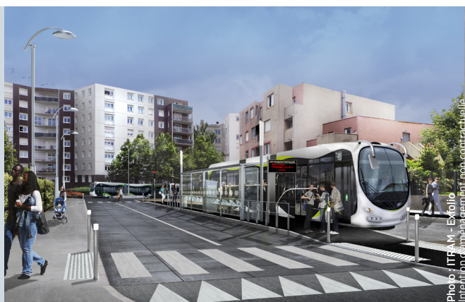
intention d'aménagement non contractuelle

La nouvelle ligne de Bus Tzen5 reliera le 13 e arrondissement de Paris à Choisy-le-Roi, en près de 33 minutes. Long d'environ 9 km, il desservira 4 communes : le 13 e arrondissement de Paris, Ivry-sur-Seine, Vitry-sur-Seine et Choisy-le-Roi. Il sera en correspondance avec le Tram 9 à Choisy-le-Roi et avec le Métro 15 à Vitry-sur-Seine.