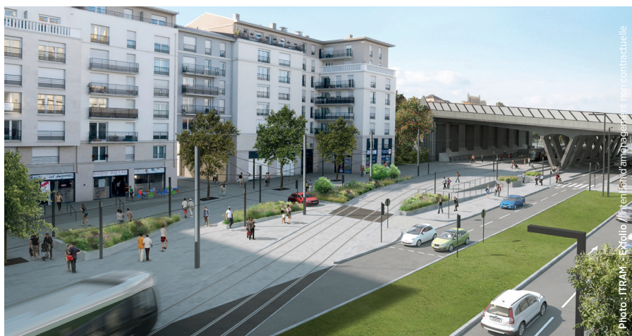
Le réaménagement autour de la station Trois Communes

Avant la mise en service du tramway, des essais de circulation sont effectués durant quelques mois pour tester le système de transport, les équipements, le freinage ou la signalisation.