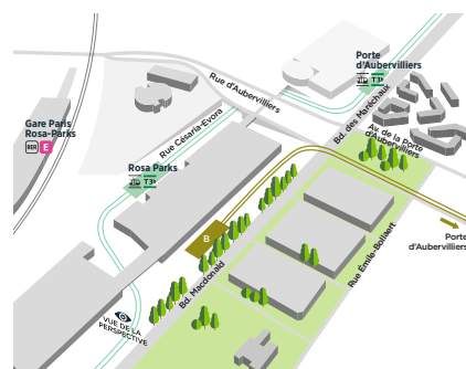
Variante B de l'arrivée du tram T8 à la gare Paris Rosa-Parks