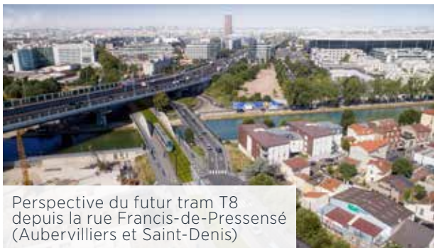
Perspective du futur tram T8 depuis la rue Francis-de-Pressensé (Aubervilliers et Saint-Denis)

Le projet prévoit de prolonger le tram T8 de Saint-Denis Porte de Paris jusqu'à la gare de Rosa-Parks, au nord du 19 e arrondissement parisien. Au total, ce sont 5,5 kilomètres de tramway supplémentaires qui vont accompagner la métamorphose d'un territoire en pleine mutation.