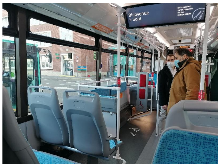
Marquage au sol zone PMR et poussettes