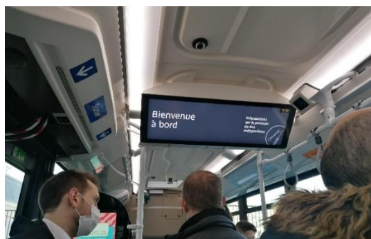
Écran d'information 37 pouces