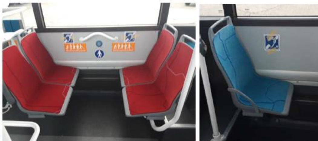
Zone PMR et UFR avec système de Boucle sonores à Induction Magnétique (BIM)