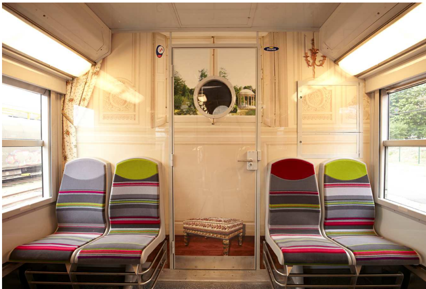
Chambre de la Reine au Petit Trianon avec vue sur le temple de l'amour