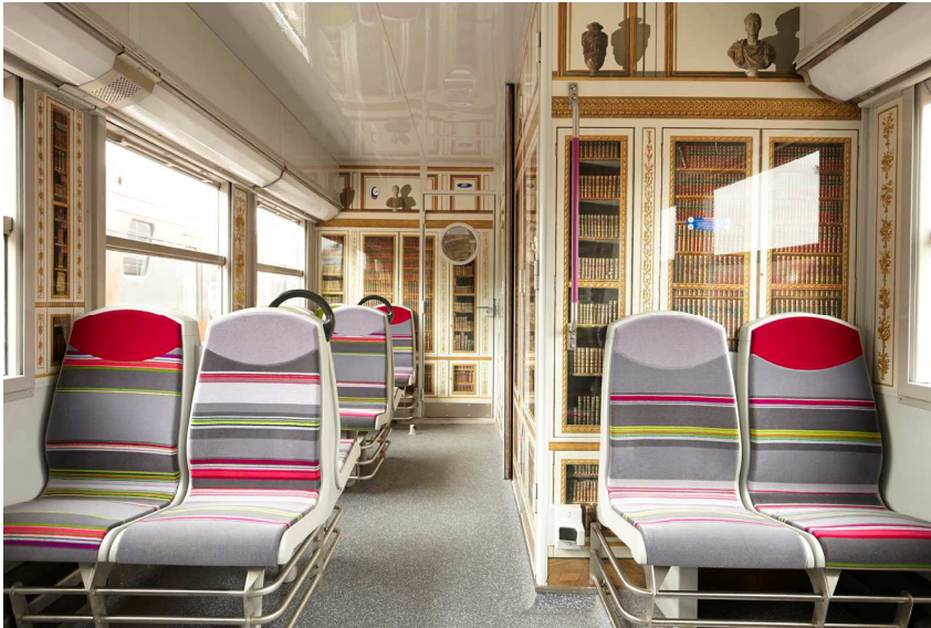
Bibliothèque de Louis XVI, appartement intérieur du roi dans le château