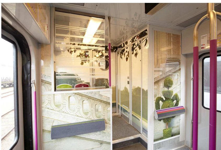
Evocation des topiaires et des perspectives du jardin de Versailles