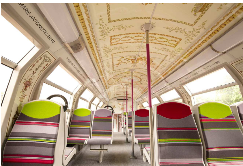
Intérieur du Belvédère au domaine de Marie-Antoinette