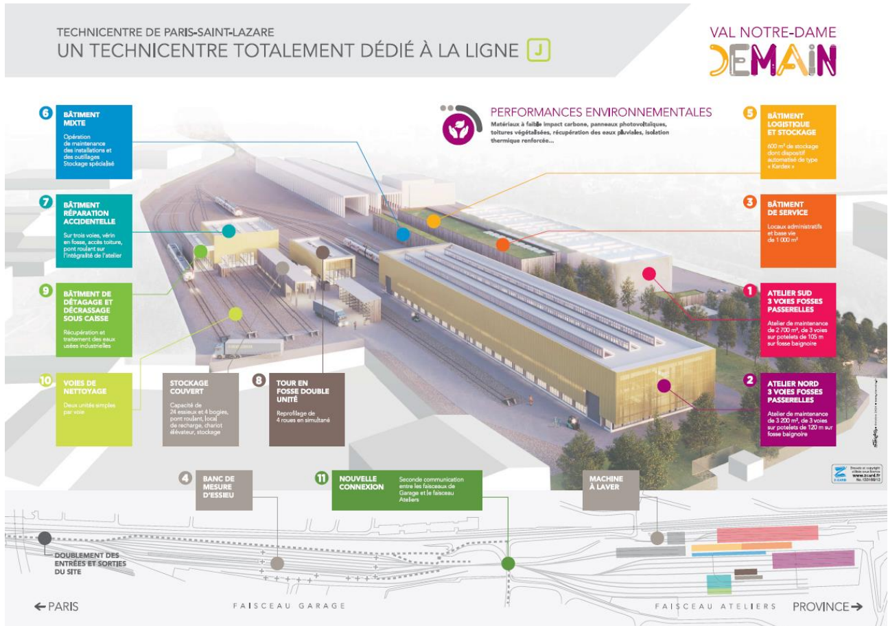
Technicentre Val Notre Dame Demain phases 1 et 2 – Ligne J – Transilien SNCF

Le phase 2 de Val Notre Dame Demain sera livrée à l’horizon fin 2024.