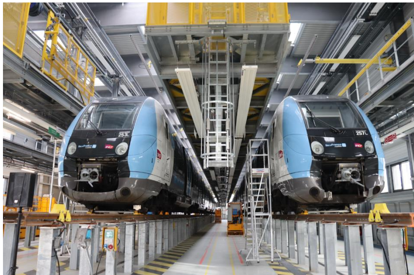
Technicentre Val Notre Dame Demain phase 1 – Ligne J – Atelier 3 voies

La phase 1 du projet Val Notre Dame Demain financée par Île-de-France Mobilités pour la réalisation de :