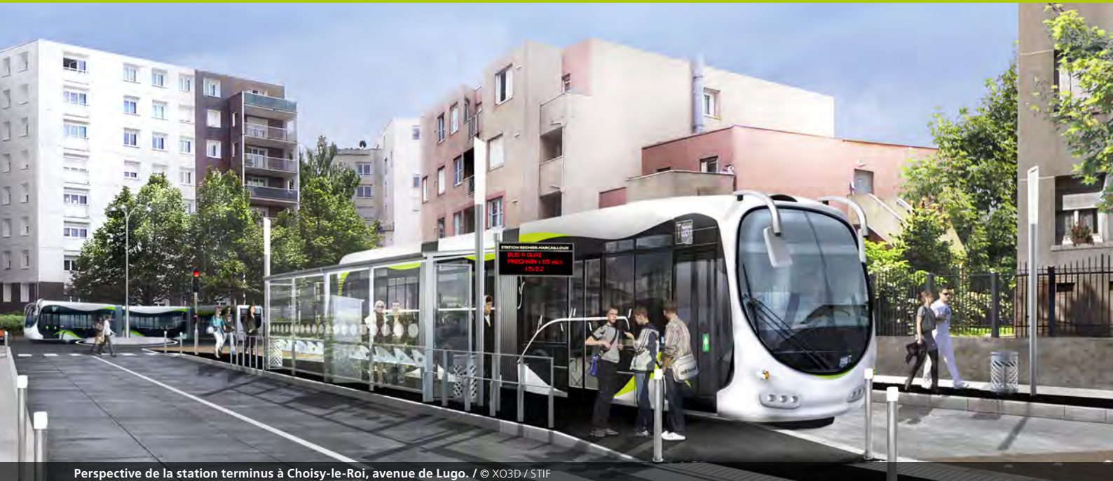
Perspective de la station terminus à Choisy-le-Roi, avenue de Lugo.