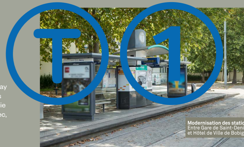
Modernisation des stations Entre Gare de Saint-Denis et Hôtel de Ville de Bobigny

Face à ce constat, la RATP, en lien avec Île-de-France mobilités et les collectivités locales (villes et départements), a élaboré un programme d'actions coordonnées (PACT T1) visant notamment la mise à niveau de la ligne en améliorant l'exploitation (régularité, désaturation des quais, etc.), le confort et l'accessibilité, y compris pour les personnes à mobilité réduite. Dans ce cadre, des travaux d'agrandissement et de modernisation des quais des stations, sur la partie historique, sont envisagés. Ils font l'objet de la présente concertation.