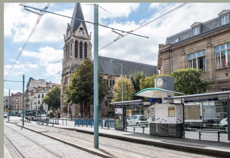
STRATÉACT - PHOTOS : BRUNO MARGUERITE / RATP

Informez-vous et donnez votre avis sur le projet de modernisation des stations du tramway T1 entre Gare de Saint-Denis et Hôtel de Ville de Bobigny.