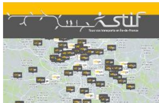
Carte Véligo interactive disponible en ligne sur http://www.stif.info/carte-veligo.html

Cet espace sécurisé comprend 60 places accessibles 7 jours sur 7 et 24 heures sur 24, avec une carte Navigo chargée d'un forfait en cours de validité (Semaine, Mois, Annuel, imagine R Scolaire ou Étudiant, Solidarité Transport). Pour accéder au service, un abonnement annuel de 20 € doit être souscrit. La gestion de ces espaces est assurée par SNCF Transilien, qui l'a déléguée à Kisio Service, filiale du Groupe SNCF. Le coût d'aménagement de l'espace sécurisé d'un montant d'environ 90 000 € HT, est financé par le STIF à 75 %, par la Ville de Paris à 12,5 % et par SNCF Gares & Connexions à 12,5 %.