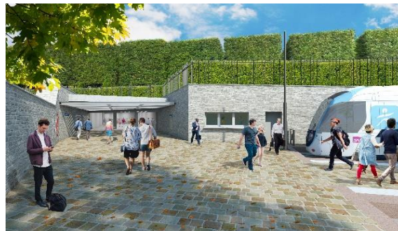
Entrée du couloir de correspondance