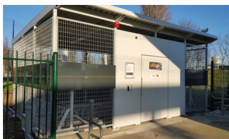
Créteil Pompadour (Ligne D)