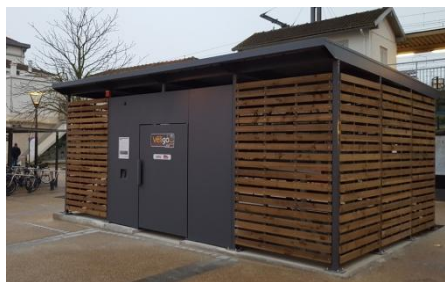
Bretigny-sur-Orge (Ligne C)

Les beaux jours sont l'occasion pour beaucoup de Franciliens de redécouvrir le plaisir du vélo. Pour les accompagner, SNCF Transilien et le STIF continuent de déployer Véligo, le stationnement vélos imaginé et financé par le STIF, avec près de 380 nouvelles places de stationnement sécurisées et l'ouverture du site www.veligo.transilien.com